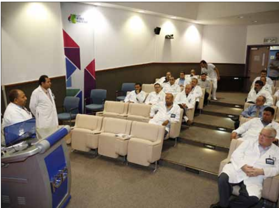
جانب من إحدى المحاضرات

ويقوم طبيب الأذن بالكشف على الأذن الخارجية أو الوسطى لاكتشاف المرض وعلاجه، وعندما يظهر الكشف عدم وجود مرض